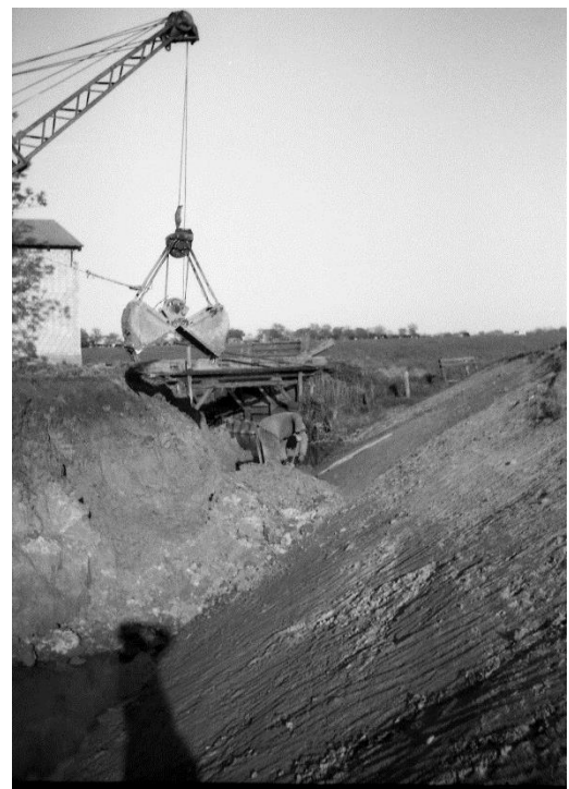
Dat duerte nich mehr lang un de Bagger hall all de Probleme um dat Groov kleien löst. De Tied leep doröver henn.